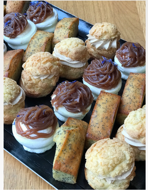
Bouchées salées & sucrées